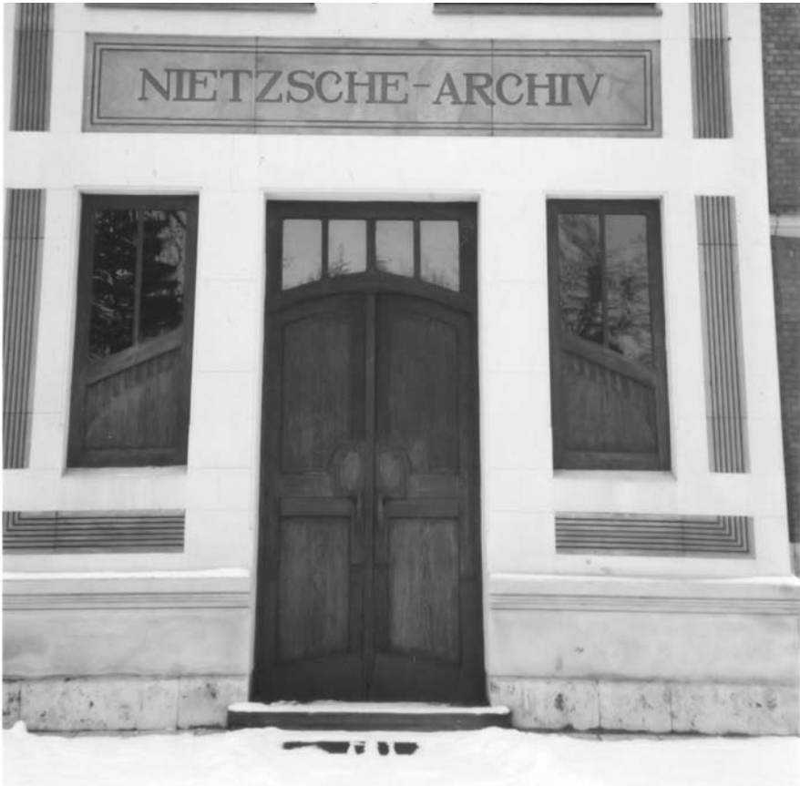
Vooraanzicht van de Nietzsche-villa te Weimar